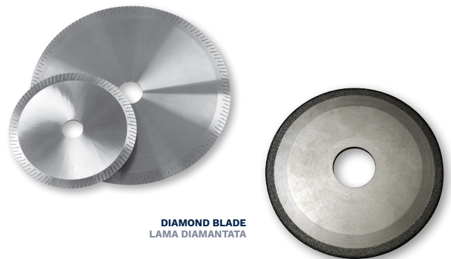
DIAMOND BLADE LAMA DIAMANTATA

*SMOOTH BLADES AVAILABLE UPON REQUEST *LAME LISCE DISPONIBILI SU RICHIESTA